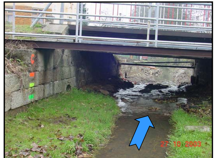
Překážku v toku tvoří trubky pod mostem.