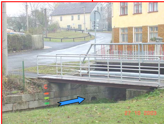
Komunikace Nová Role, Božičany, Chodov.