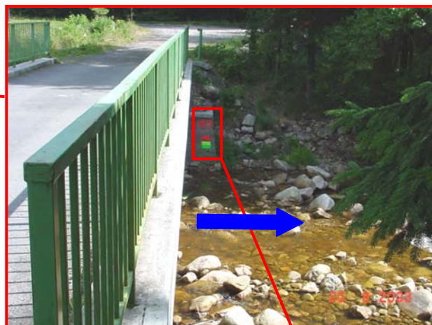
Most „K Lanovce“