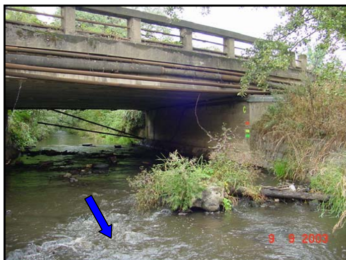
Současně i místo omezující odtokové poměry.