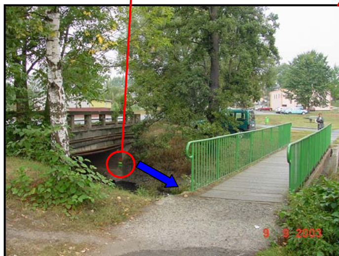
Most přes Chodovský potok.