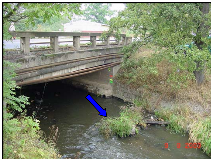
„C“ levý břeh potoka povodňové strany mostu.