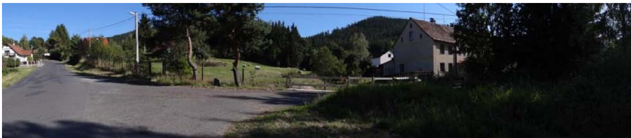
Celkový pohled na ohroženou lokalitu č.p. 1.