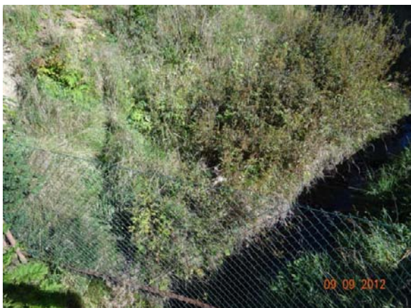
Pletivový plot přes koryto přímo nad mostem, dojde k ucpání profilu mostu.