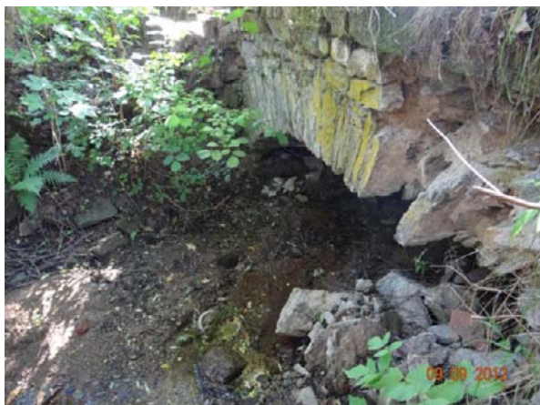
Kamenný klenbový staticky narušený most na cestě pod objektem č.p. 1.