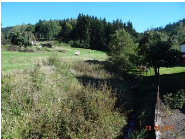
Pohled ke kritickému bodu a do sběrné plochy.