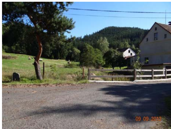
Ohrožená nemovitost č.p. 1.