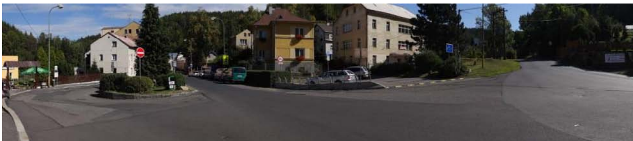
Ohrožené nemovitosti pod školou (krytý profil toku).