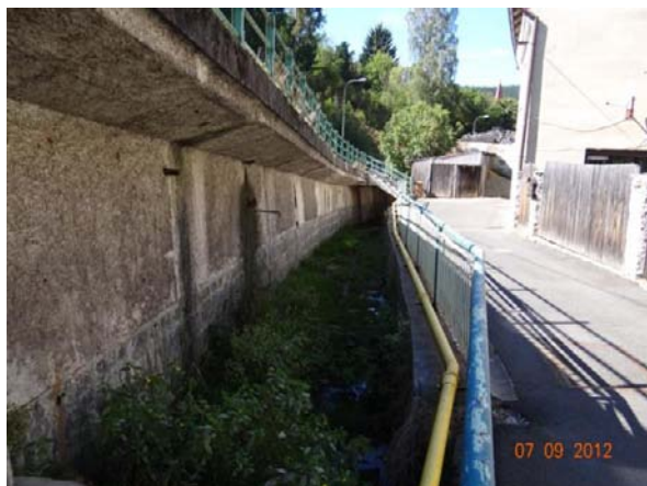
Koryto toku v Keramické ulici. Ohroženy rodinné domy.