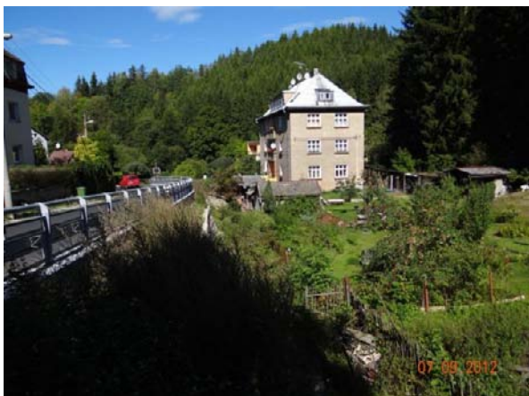
Ohrožená bytová zástavba v Březové (č.p. 145).