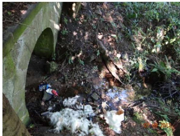
Nekapacitní profil nad Březovou - dojde k přelítí komunikace.