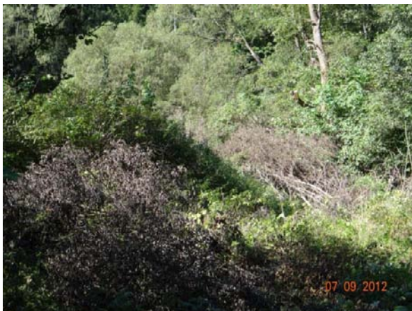
Ponechaný výřez koryta Cínového potoka nad Březovou.