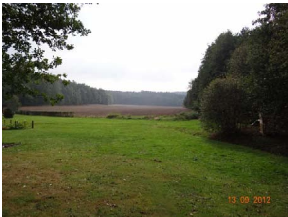
Sběrná plocha nad č.p. 16.