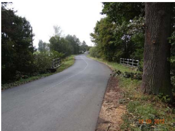
Most 21413-1 u č.p. 4.