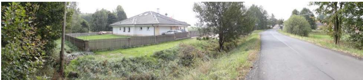
Ohrožený objekt č.p. 4.