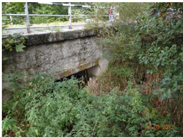
Detail mostu 21413-1.