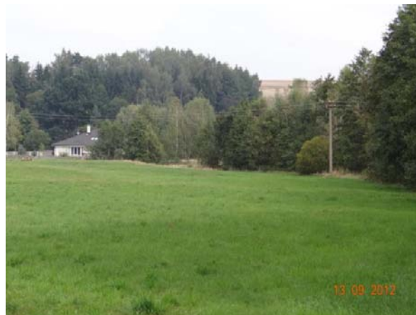
Pohled od kritického bodu k ohroženému objektu č.p. 4.