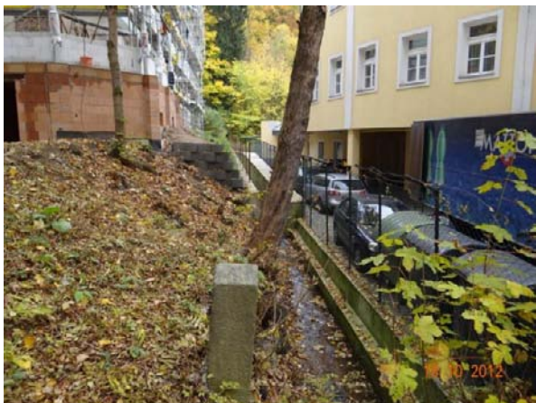
Velmi úzké koryto mezi hotely č.p. 190 a 92.