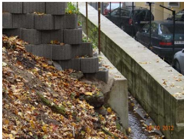
Koryto nad ZUŠ.