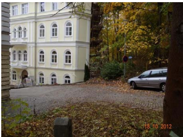
Mostek nad ZUŠ u hotelu.