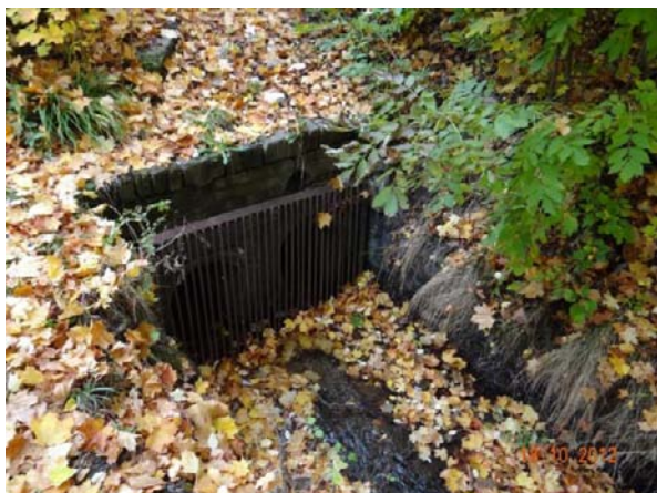
Nátok do krytého profilu u ZUŠ.