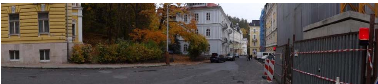
Celkový pohled na ohroženou lokalitu u nátoky do krytého profilu.