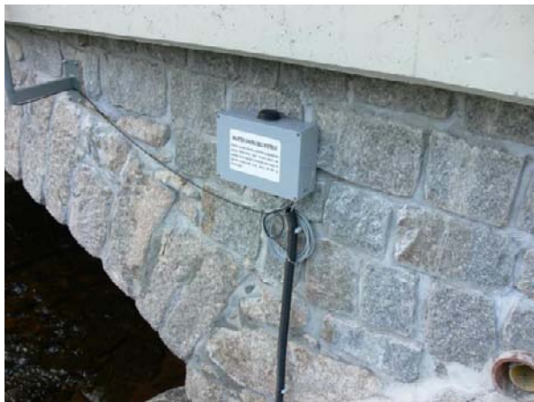
Hlásný profil Svazku obcí Bystřice v ř.km 23,55 na mostu 219-013 u č.p. 121.