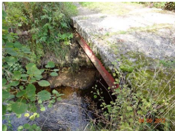
Detail mostovky, může dojít k záchytu splávní.