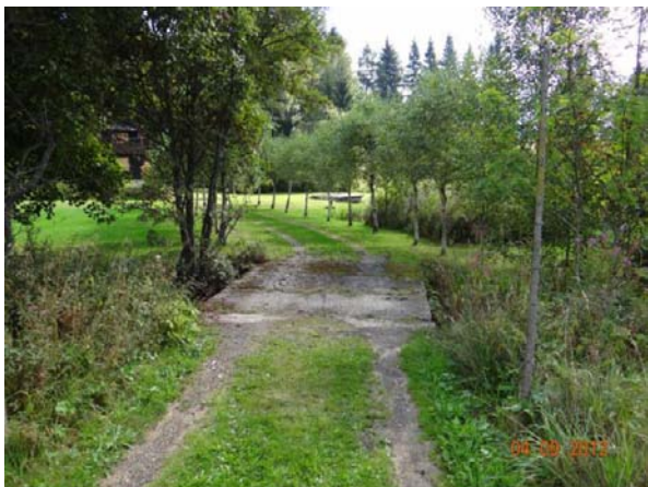
Přístupový mostek k nemovitostem č.p. 67 a 72.