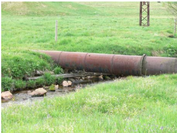
Historická ocelová trouba v korytě pod kritickým bodem, účel na OÚ nezjištěn.