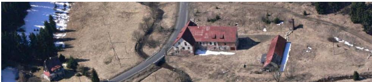
Celkový pohled na lokalitu mostu 219-013 s hlásným profilem BY-02.