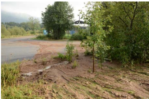
Důsledek přívalové srážky 25. 8. 2011 nad areálem PARABIT.