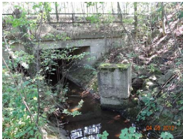
Železniční propust, může dojít ke kumulaci splávi na nefunkčním pilíři.