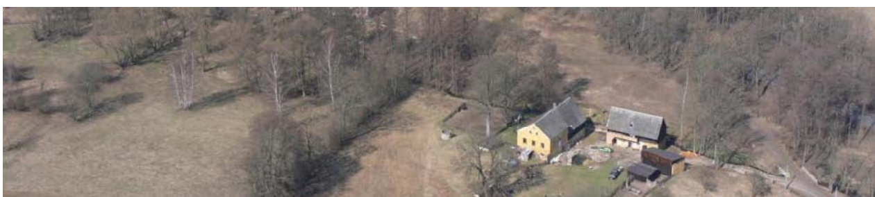
Celkový pohled na lokalitu č.e.1 v Bystřici.