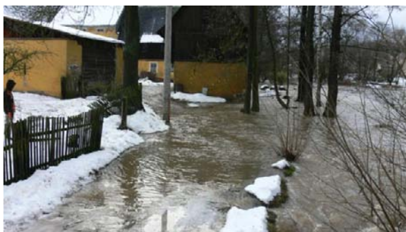
Ohrožená nemovitost č.e.1 v místní části Bystřice.