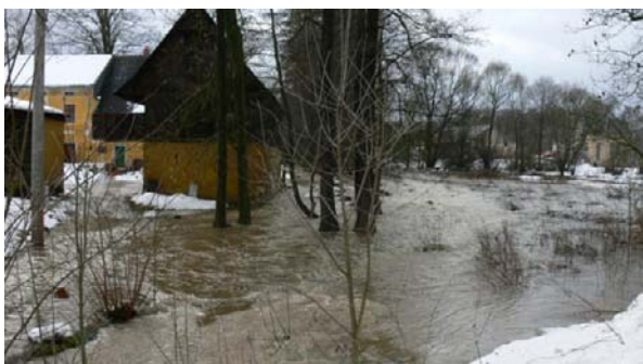
Ohrožená nemovitost č.e.1 v místní části Bystřice.