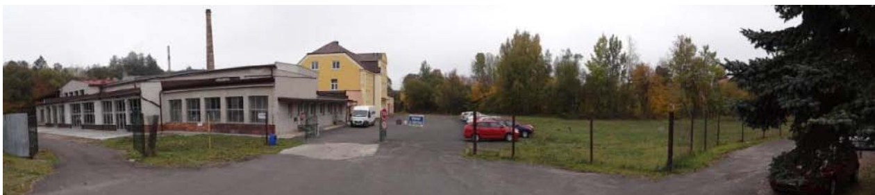
Ohrožený areál prádelny.