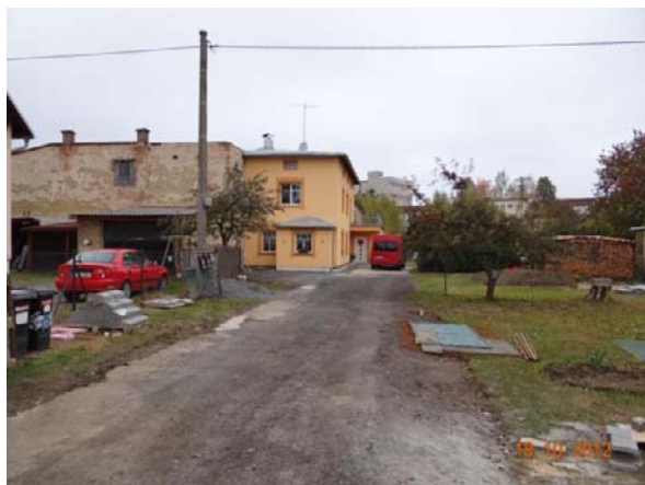
Ohrožené zahrady a objekty nad prádelnou.