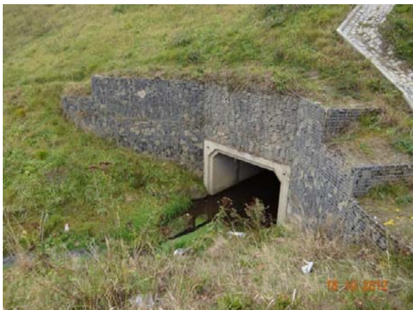
Krytý profil odtoku z rekreačního střediska Riviera pod novým obchvatem obce.