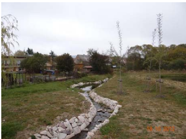
Revitalizované koryto nebude pro povodňové průtoky kapacitní.