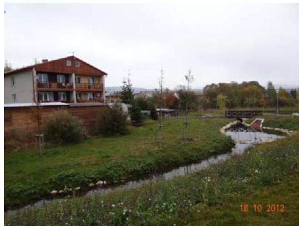
Revitalizovaná úsek toku, může dojít i k ohrožení rodinných domů.