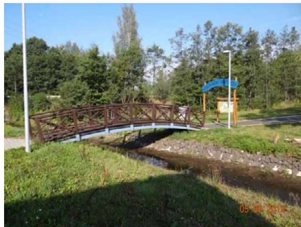
Nová lávka ke sportovně-rekreačnímu areálu.