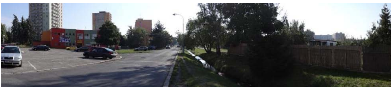
Zcela nekapacitní koryto v Chodově nad autobusovým nádražím.