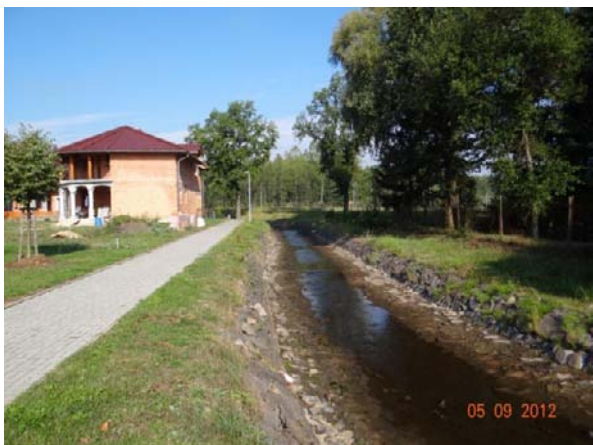
Nově budované rodinné domy jsou přímo ohroženy.