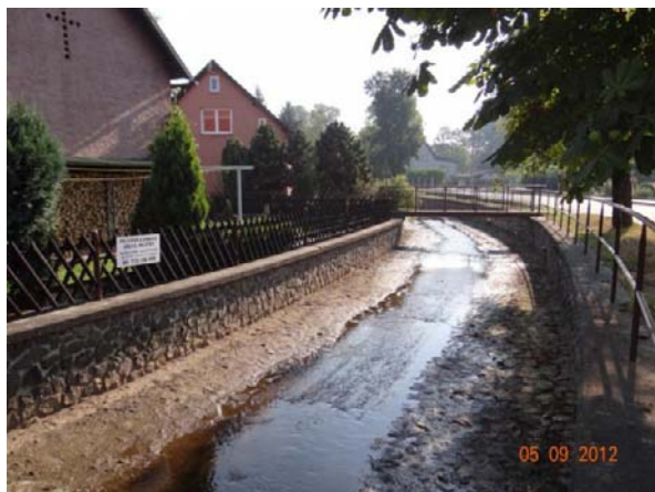
Regulované kapacitní koryto v centru Vintířova.