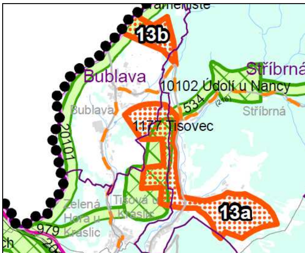
vymezení plochy v rámci ZÚR

V rámci této studie bylo navrženo upřesnění hranice vymezení plochy nadmístního významu č. 13 dle ZÚR „Bublava - Stříbrná“, rozdělené do částí 13a a 13b.